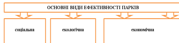
Рис. 2. Основні види ефективності парків*

Оптимальне поєднання економічної, екологічної та соціальної ефективності парків – об'єктивна підстава розглядати парки як вагомий чинник зрівноваженого розвитку регіонів, у яких вони розташовані й функціонують (рис. 2).